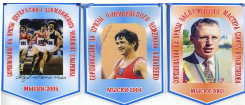
Рис. 2 — Памятные вымпелы соревнований «на призы ЗМС»

Программа олимпийского образования продолжилась после окончания соревнований в Центре творческого развития и гуманитарного образования открытием экспозиции «Сеул-88» и проведением пресс-конференции с участием олимпийца.