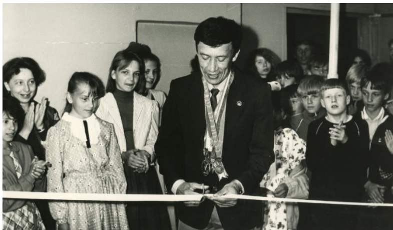
Рис. 1 — Открытие Л. Мосеевым музея легкой атлетики (1989 г)

пово, Красноярский край) и уже 27—28 мая состоялись первые соревнования по легкой атлетике среди школьников «На призы Заслуженного мастера спорта Л. Мосеева». Это были первые соревнования из цикла «На призы Заслуженных». Леонид Николаевич выходец из Челябинской области является Чемпионом Европы в марафонском беге (Прага 1978 г.), а также участником олимпийских игр в Монреале и Москве.